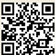
ឬស្កែន QR Code

- អ្នកអាចដាក់ពាក្យសុំអាហារូបករណ៍ជាភាសាខ្មែរតាមប្រព័ន្ធអេឡិចត្រូនិក (Online Application) ដោយចុចនៅត្រង់នេះ ឬ ស្កែនកូដខាងក្រោម https://tinyurl.com/usaiddwdscholarshipngo