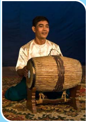
សួរសម្តែរ