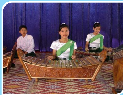
រនាតធ្មង